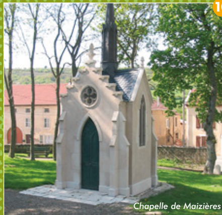
Chapelle de Maizières