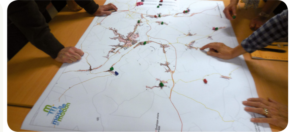
Source : Réunion PLH du 13 octobre 2015, CCMM