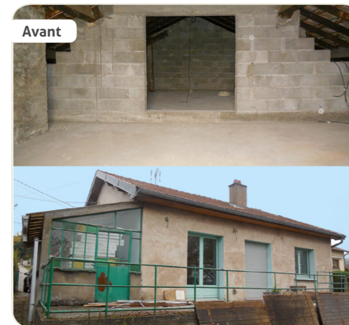
Dossier en 2015, d'un propriétaire occupant, comprenant : isolation des combles perdus, isolation des murs par l'intérieur, et changement des menuiseries.