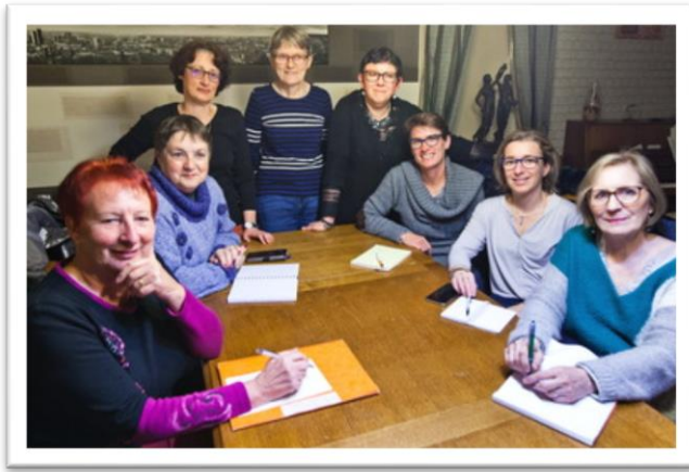
Le comité à pied d'œuvre.

Les membres du comité de l'association, heureux du succès remporté par le petit théâtre, se sont réunis pour dérouler le calendrier de leurs prochaines manifestations. L'association se mobilise pour organiser le 22 septembre un nouveau jeu original : un Cluedo grandeur nature, avec une enquête policière à résoudre. Ce Cluedo, qui se déroulera sur 12 lieux différents au centre du village réunira nombre de bénévoles ravis de s'embarquer pour une nouvelle aventure pleine de suspens.