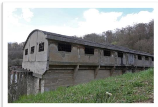
Mine du val de fer de Neuves-Maisons.

« Quand le tram de Nancy se rendait à Neuves-Maisons », découverte des travaux sur le carreau de la Mine du Val de Fer et découverte de la forêt cathédrale du bois de Réménaumont : une exception française !