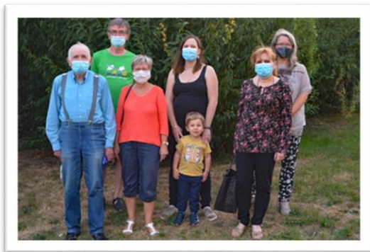
Une partie du collectif Chaligny en Transition

Un collectif de citoyens s'est constitué à Chaligny pour porter le Pacte pour la transition auprès des élus en souhaitant une large participation des habitants et des associations.