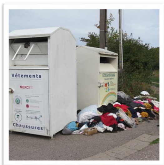
Détritus divers et vêtements s'entassent près des conteneurs.

C'est, malheureusement, devenu une triste habitude : le manque de civisme ordinaire se répand de plus en plus sur la commune. La mairie, via ses services techniques, doit continuellement nettoyer les points de collecte, de déchets, vêtements et autres débris que des individus sans scrupule entassent autour des conteneurs. La mairie a plusieurs fois alerté la CCMM (Communauté de communes Moselle et Madon) sur le non-respect de ces conteneurs relais, problème également rencontré par d'autres communes, quand ce n'est pas dans la forêt ou les espaces naturels environnants. La mairie rappelle qu'un dispositif de vidéoprotection couvre la zone concernée (espace J.Lamour) et que l'identification de ce genre d'incivilités peut coûter cher. Alors qu'il suffit de se rendre sur d'autres sites de collecte proches.