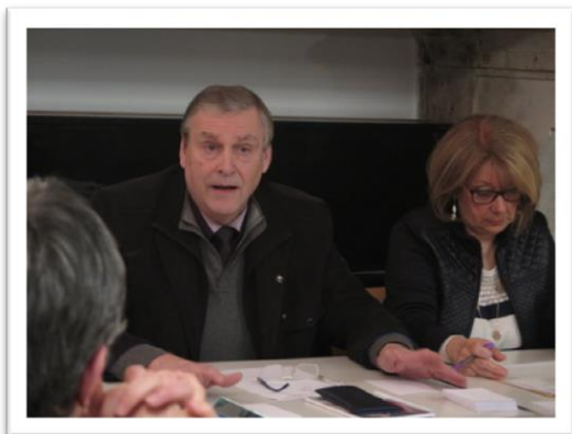
Le maire réfute les attaques contenues dans un tract anonyme.

Contestés dans un tract anonyme, les travaux d'aménagement de la traversée de Méréville sont farouchement défendus par la municipalité.