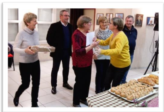
Remise de prix pour les décorations de Noël.