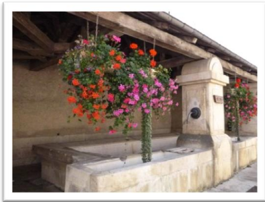
Le patrimoine de Viterne : les fontaines

2018 fut l'année des travaux suivants : la réfection du chéneau de l'école, le monument aux morts, l'aménagement des trottoirs rue de la grosse côte, la réfection à l'ancienne du mur de la petite côte. En 2019, le patrimoine va être mis en valeur avec la réfection des fontaines. 23 donateurs ont répondu présent, il est toujours possible de faire un don à la fondation du patrimoine. L'effort apporté au maintien d'une situation financière saine permettra peut-être