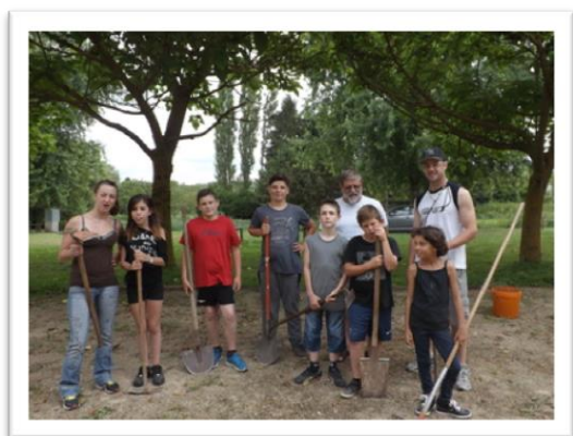
Six jeunes participent à cette opération sur Pulligny.