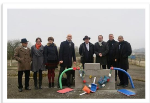
Pose de la première pierre de la piscine en présence de nombreux élus du territoire (.)

Dans un peu plus de deux ans, la nouvelle piscine de Moselle et Madon ouvrira ses portes et remplacera l'actuelle âgée de plus de 40 ans et qui ne répond plus aux attentes des habitants. D'un coût d'environ 12 M€, le nouvel équipement sera orienté vers les sports aquatiques avec un bassin sportif éducatif de 25 x 15 m en inox proposant 6 couloirs de nage dont le fond sera mobile sur une partie du bassin. Les loisirs seront également de la partie avec un