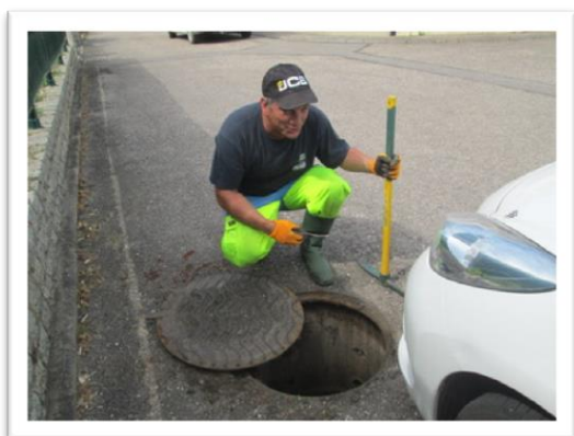
Le réseau d'assainissement exploré.

Depuis la réalisation de la station d'épuration, la communauté de communes Moselle et Madon, fait procéder à un contrôle systématique de son réseau d'assainissement.