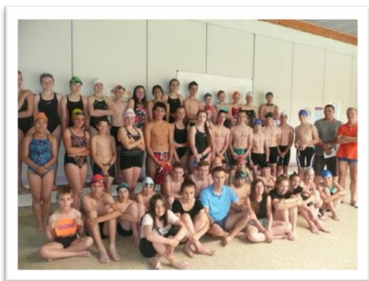
Ensemble, les élèves de Jules-Ferry et de Jacques-Callot se perfectionnent en natation au sein d'un club commun