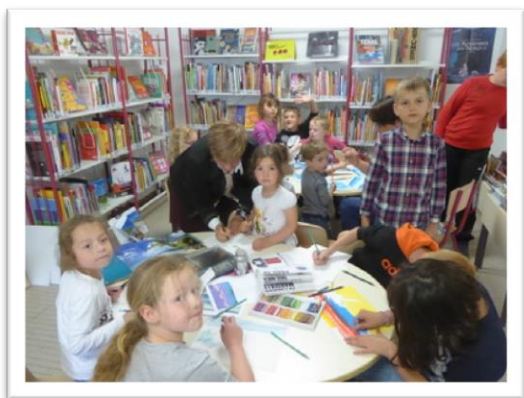
Illustration des contes par les enfants.