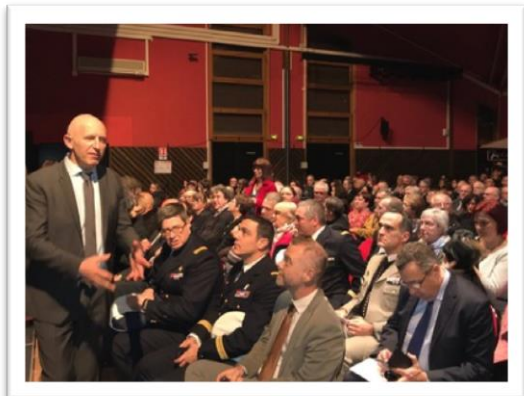
Salle archicomble pour Dominique Potier.