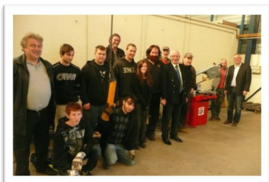
Six apprentis bien encadrés.

Contrairement à une idée reçue, les métiers du fer ont encore un bel avenir. La nouvelle usine de composants pour l'aéronautique de Commercy ne trouve pas de chaudronniers.