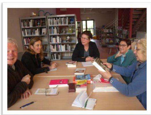
Une matinée autour des livres.

Les « Coups de coeur café » ont repris du service ce samedi autour de six personnes.