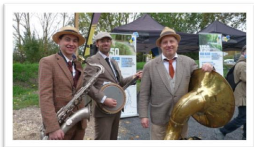
Pas de fête sans musique !