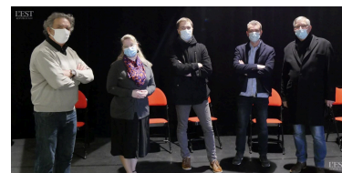
Les élus se sont rendus au centre culturel Jean-L'Hôte.

citoyens puissent à nouveau se retrouver autour des grandes fêtes et événements à Neuves-Maisons. ■