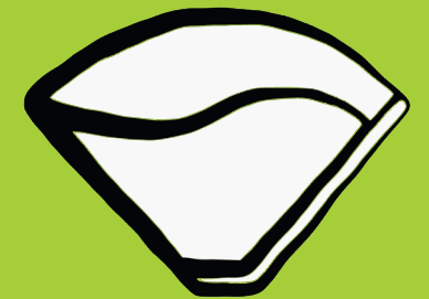
Marc de café, filtres, dosettes (en papier)