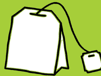
Thé et tisane en vrac ou sachet (sauf en nylon)