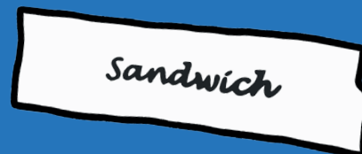
Sachets de sandwich ou de boulangerie