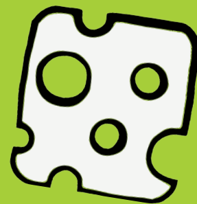
Croûtes de fromage