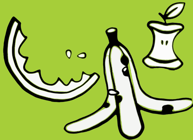
Restes de fruits et pelures d'agrumes