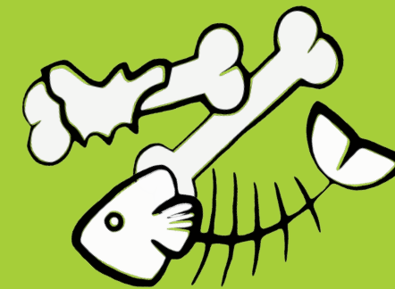
Restes de viande ou poisson