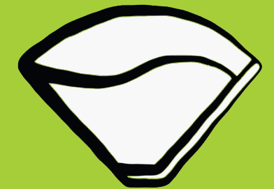
Marc de café, filtres, dosettes (en papier)