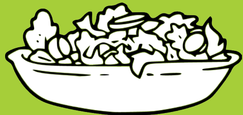
Légumes non consommés