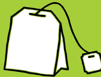
Thé et tisane en vrac ou sachet (sauf en nylon)