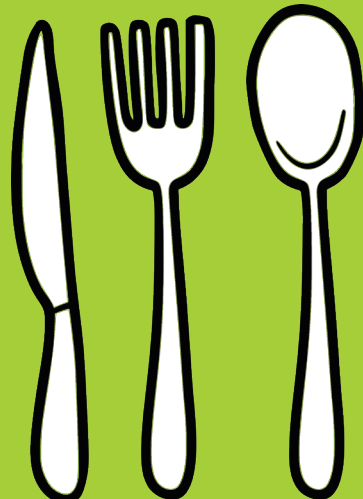
Couverts en bois