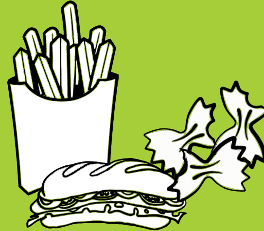
Restes de repas