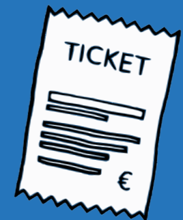
Tickets de caisse et autres petits papiers