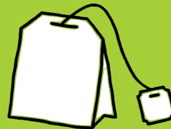
Thé et tisane en vrac ou sachet (sauf en nylon)