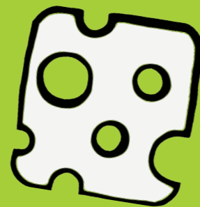
Croûtes de fromage