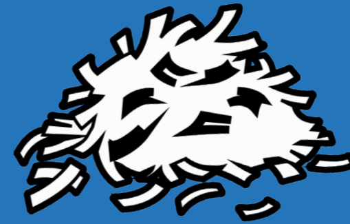
Papier déchiqueté ou déchiré