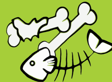
Restes de viande ou poisson