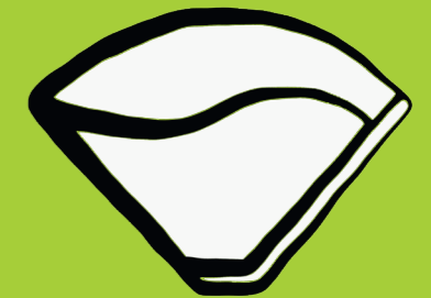
Marc de café, filtres, dosettes (en papier)