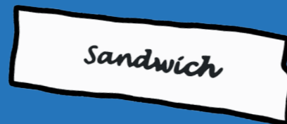
Sachets de sandwich ou de boulangerie