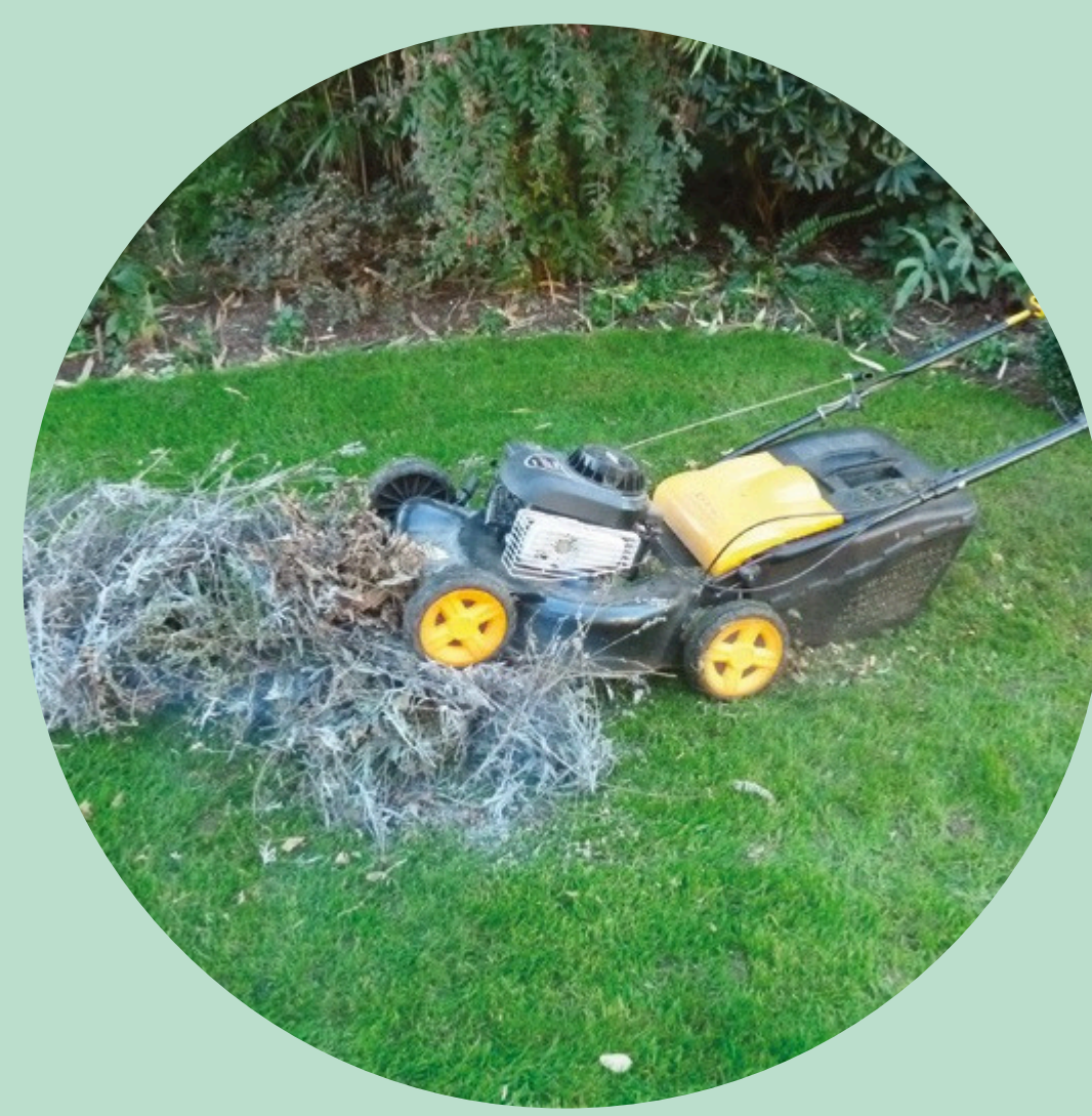
BROYAGE À LA TONDEUSE