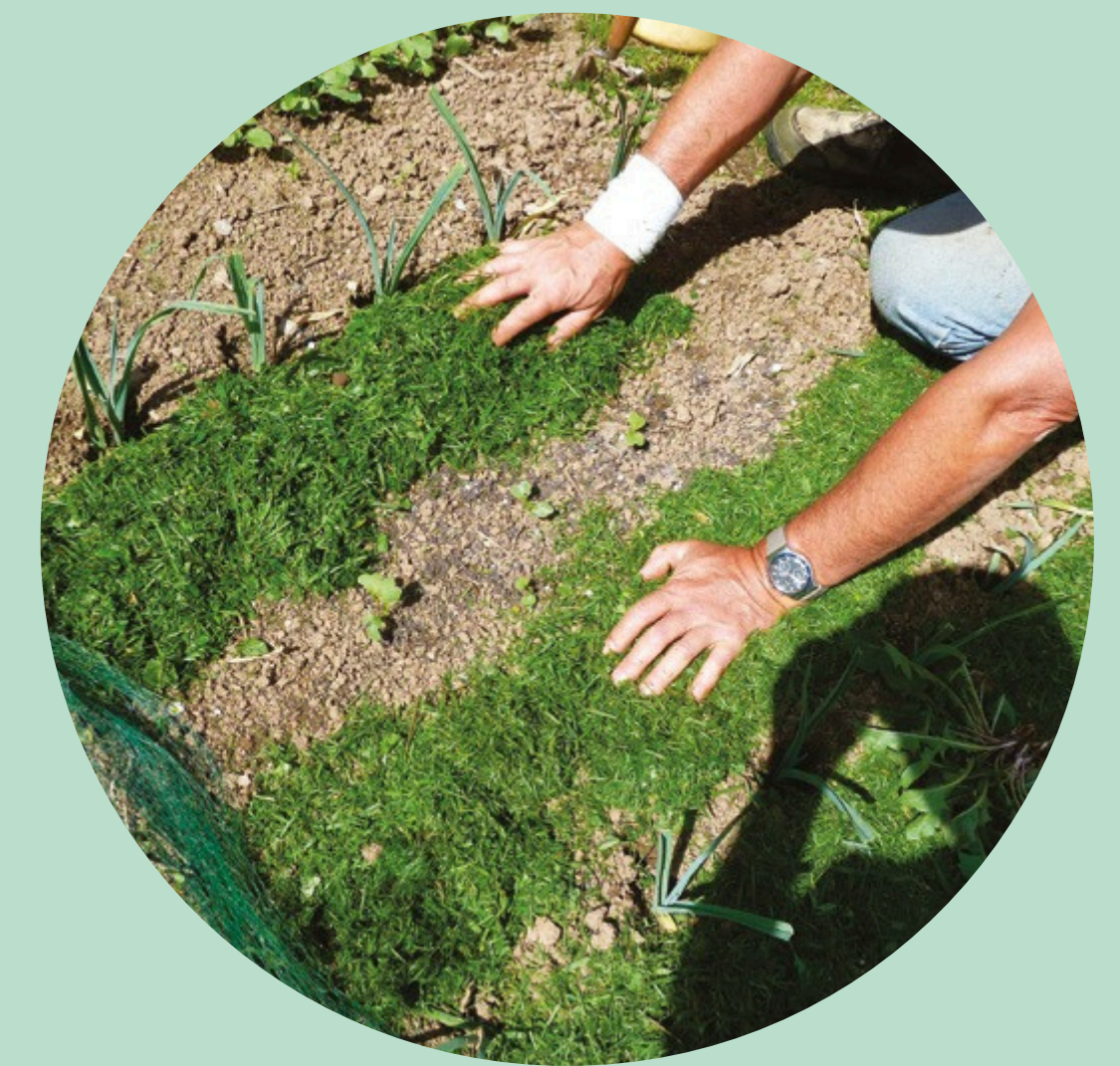
EN PAILLAGE * (2cm max)