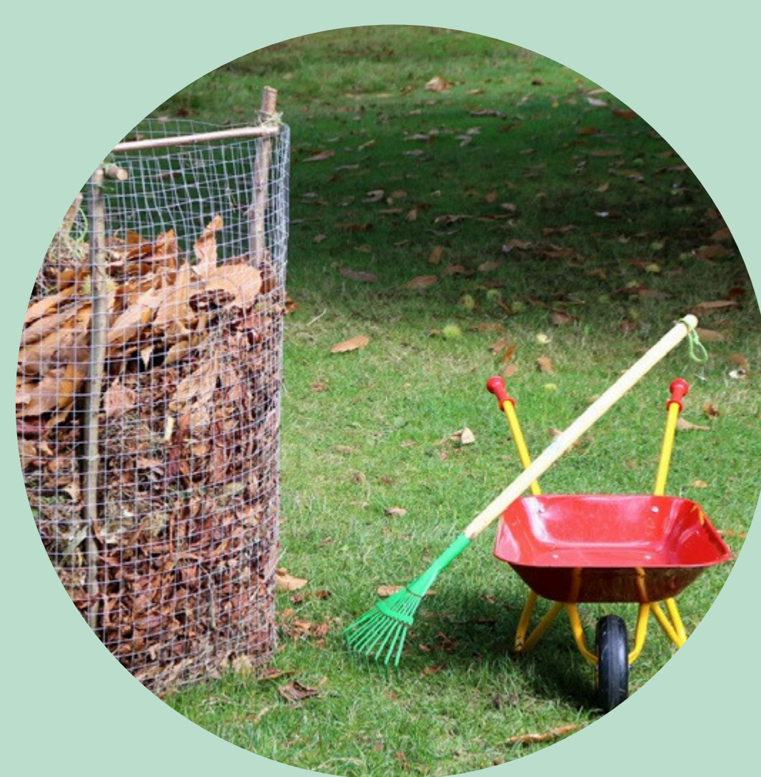
STOCKAGE EN SILO