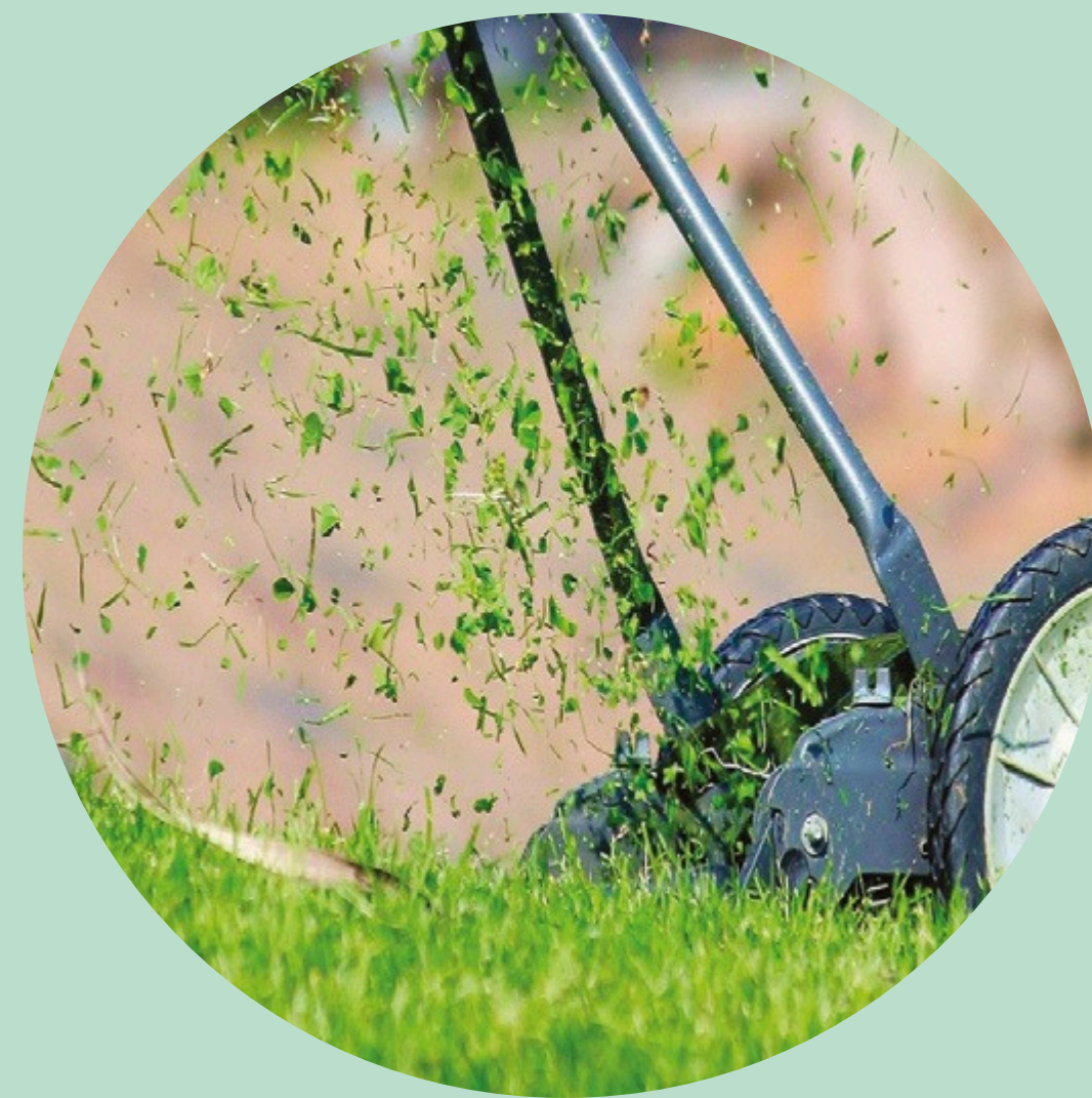
EN MULCHING *