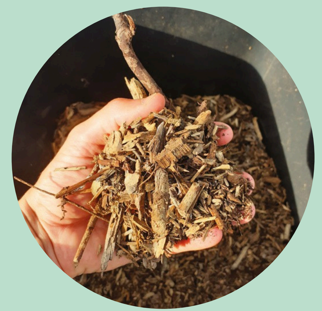
EN COMPOSTAGE *