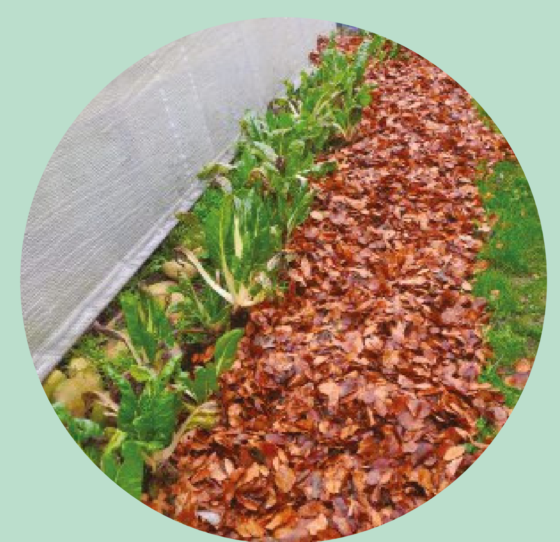
EN PAILLAGE * (5cm et +)