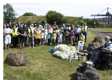
Les bénévoles ont répondu présent contre la pollution.

Ce sont environ 70 personnes qui ont répondu à l'appel. L'opération sera renouvelée dans d'autres zones et sur le plateau Sainte-Barbe. ■