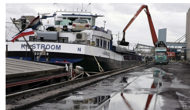
On compte 158 kilomètres de Moselle canalisée entre Neuves-Maisons et Apach.

Les avantages du transport fluvial sont reconnus : silencieux, peu consommateur d'énergie et faible émetteur de CO 2 . La Moselle canalisée n'est pas la seule sur ce marché. Un peu plus à l'ouest, le canal Seine-Nord-Europe à grand gabarit, financé par les pouvoirs publics, sera opérationnel en 2027. ■