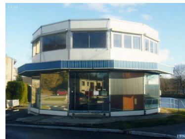
La célèbre station-service Total Prouvé de Messein a été construite en 1971.

C'est donc en pièces détachées qu'elle est mise aux enchères ce vendredi. Son prix est estimé entre 40 000 et 60 000 €, avec l'escalier historique qu'il y avait à l'intérieur. ■