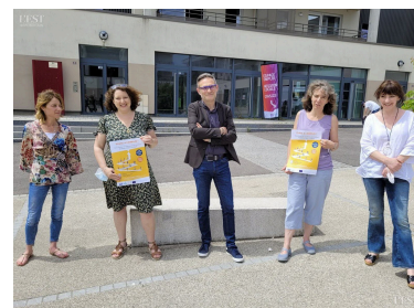
Les responsables des différentes structures d'aide à l'emploi et le vice-président de la Com'Com pour le développement économique et l'emploi invitent tous les demandeurs à l'événement du 24 juin.

Place à l'emploi jeudi 24 juin de 14 h à 16 h place des Tricoteries à Chaligny. Ouvert à toute personne en recherche d'emploi. Contact téléphonique : 09 74 36 04 50 ■