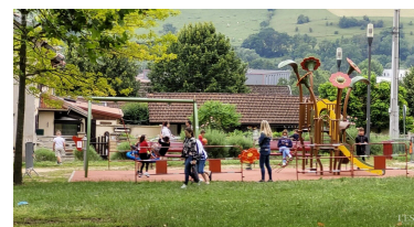
Le conseil a donné son accord pour le règlement de la facture du jeu installé place Albert-André.

- Le maire doit signer avant le 13 juillet une convention avec l'Éducation nationale, qui subventionne l'installation de 2 écrans numériques (un pour chaque école élémentaire) et l'installation d'un espace de travail numérique dans chacune des écoles. Délibération adoptée à l'unanimité. ■