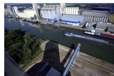
Le port de Metz est le premier port céréalier de France.

CFNR, présente dans le tour de table de la CCI lors du premier appel d'offres, fait sa propre proposition. Cette dernière est « technique » et colle parfaitement au cahier des charges fixé par les élus. La CCI se maintient avec ArcelorMittal. Un troisième candidat se déclare : le céréalier In vivo, qui, avec l'absorption en cours du groupe Soufflet, affiche un chiffre d'affaires de 10 milliards d'euros. Le dossier est solide mais porte l'empreinte du maire de Metz. La CFNR a souhaité calmer les esprits. Le principe d'une seule autorité semble avoir vécu. Gageons que, dans trois ans, les ports de Meurthe-et-Moselle, celui de Thionville et ceux de Metz retrouveront un peu d'autonomie, à l'instar de ce qui se fait en Alsace. ■