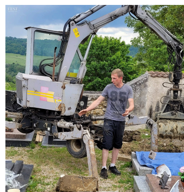
38 tombes aux concessions échues et non renouvelées sont en cours de relevage par les marbriers de l'entreprise Guidon à l'aide d'une pelle Boki.

Ces travaux ont interdit tout accès au cimetière plusieurs jours. ■