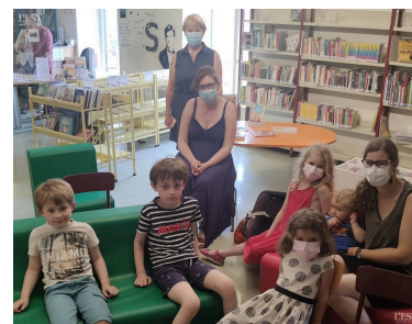
Notre conteuse en arrière-plan avec quelques mamans et les enfants.

« Pour leur lire des livres prévus sur la mythologie, j'ai dû m'adapter à leur âge pour les intéresser » confie la conteuse. Pari réussi, en petit comité. ■