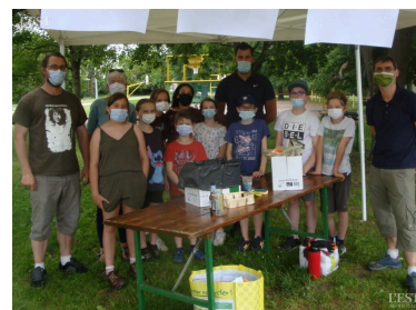
Ados et animateurs ont prévu une autre journée.

Une danse a clos cet après-midi. Tous se sont promis de se retrouver pour une nouvelle journée. ■