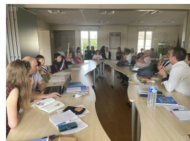
Lutte contre les incivilités, fête de fin d'année : les jeunes élus proposent à leurs aînés quelques idées rassemblées collectivement.

Il a salué l'investissement de ces jeunes élus et leur a rappelé que « l'écharpe [qu'ils] portent est le signe du respect de notre devise : Liberté, Égalité, Fraternité ». ■