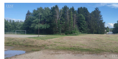
Le projet « Fontaine du Chêne, rue du Jardinot » est dans les tuyaux. Les travaux devraient débuter bientôt.

L'Agence nationale du sport (ANS) a été sollicitée pour subventionner l'installation d'un nouveau city stade, d'un skate park et de six terrains de pétanque aux normes de la FFPJP, (Fédération française de pétanque et de jeu provençal), dont le coût prévisionnel s'élève à 138 498 € TTC, susceptible de bénéficier d'une subvention d'équipement de la part de l'ANS, qui pourrait aller jusqu'à 80 %. Le plan de financement prévisionnel de cette opération serait le suivant. Coût total : 115 415 €. Part de l'ANS : 80 %, soit 92 332 €. Auto-financement communal : 20 %, soit 23 083 €. La réalisation de ces infrastructures, entamée dès accord de l'octroi de la subvention par l'ANS, devrait se terminer au troisième trimestre 2022. Nul doute que ce beau projet va redynamiser le sport dans la commune. ■