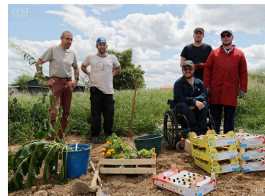
Prêts pour la plantation.

le projet. Le terrain choisi a été labouré et préparé avec le personnel de la ferme et les habitants volontaires. Le personnel de la Faisanderie veillera à l'entretien, le terrain se situant à proximité de la ferme. Pour tous renseignements, s'adresser à la mairie. ■