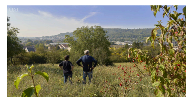
C'est dans cette parcelle de 13 hectares que devaient être construits les 300 logements entre Chaligny et Neuves-Maisons.