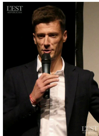
Le 15 mai 2022, il a été élu meilleur arbitre de la saison de Ligue 1 aux Trophées UNFP.

près de chefs d'entreprise et de personnalités publiques. ■