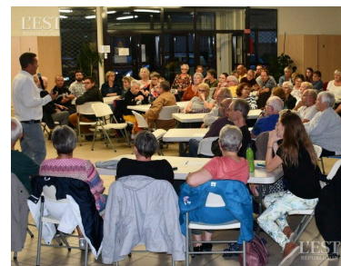
Un auditoire attentif face au « maître de cérémonie ».

Ainsi, la municipalité s'équippa en 2023 d'horloges astronomiques permettant de réguler cet éclairage public. La commission « environnement » présentera dans les prochains mois une proposition un peu plus affinée au conseil municipal. ■