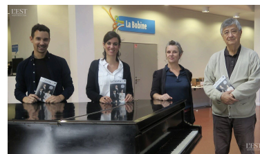
Un programme dense concocté par la petite « famille » de la Filoche.

musique, la grammaire, un tas de choses sont rangés par famille. » ■