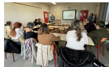
Le lycée La Tournelle étudie la mise en place de cette action en partenariat avec la Mission Locale Terres de Lorraine.

préparent à énormément de métiers qui recrutent ; c'est pourquoi nous avons, le lycée La Tournelle et la Mission Locale, la volonté de créer un partenariat afin de proposer toute une palette de solutions pour lutter contre le décrochage et retrouver la motivation ». ■