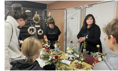
Le marché de Noël de la MJC des Castors a attiré du monde.