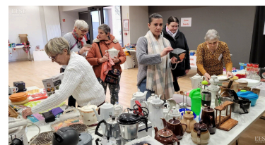
Les bénévoles de Chaligny en transition se sont affairées du vendredi au samedi matin pour disposer, sur les tables, les objets donnés.