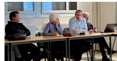
La CCMM veut mettre en place des Zones d'Accélération des Énergies Renouvelables afin de tripler la capacité des ENR d'ici 2030.

Le chemin vers la neutralité carbone d'ici 2050 se dessine ainsi avec des objectifs clairs, une volonté politique affirmée et des dispositifs concrets pour stimuler la transition énergétique au sein de la communauté de communes de Moselle et Madon. ■