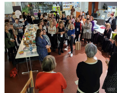
Les messages des élues communales et de la présidente du RPE ont touché au cœur les assistantes maternelles.

Accueil sans rendez-vous le 1er samedi du mois de 9 h à 12 h. ■