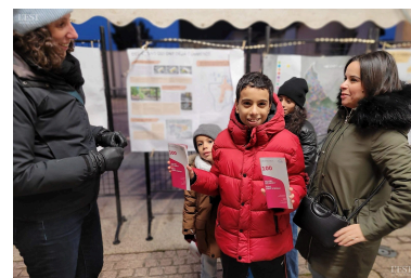
Place de l'église, la chargée de missions du cabinet Urbicaud, auteur de l'étude sur la revitalisation du centre-ville, explique le déroulement des actions futures.

La voie est maintenant toute tracée pour améliorer le cadre de vie et l'attractivité de Neuves-Maisons. ■