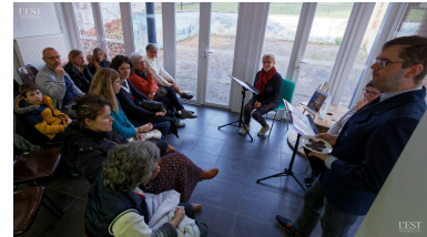
Le chocolat chatouille les narines de l'auditoire

il semblerait que le monde naquit d'une cabosse de cacaoyer, apprend-on dès la première histoire lue en alternance par 2 conteuses. A chacune des histoires correspondait le chocolat produit par le pays cité : des chocolats venus du Brésil, Madagascar, Java, Tanzanie, Mexique. Retrouvez les revues et nombreux livres à l'antenne de La Filoche, maison des associations. ■