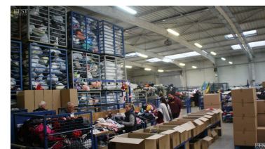
Les ballots de vêtements sont réceptionnés et entreposés dans le vaste hall de l'entreprise.

« Aventure humaine industrielle », la formule se décline en réseau d'entraide au service de l'insertion et de l'aide à l'emploi, des réunions de travail dans le souci du « mieux commun », un accompagnement dans la recherche d'un emploi pérenne hors du réseau et la volonté de maintenir et développer un circuit économique solide financièrement, positif en termes sociaux... En un mot : vertueux. ■