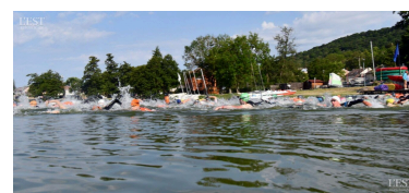
Le triathlon à la base nautique de Messein a réuni plus de 400 participants.

Sur le podium le soir, à la remise des coupes et des lots, des compétiteurs bien fatigués mais ravis de cette belle opportunité de se dépenser. ■