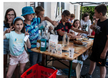
L'équipe du CMJ a passé un moment joyeux et gourmand au stand goûter offert.