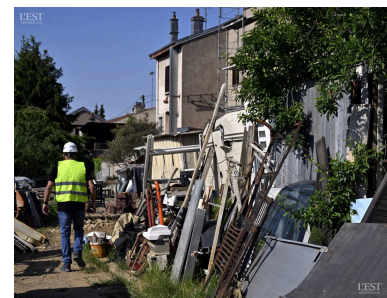
Près de l'entrée de la propriété, les objets hétérogènes s'amoncellent chez ce propriétaire chavinéen.

Même si l'immense majorité des infractions en urbanisme se règle en amont, cette disposition devrait permettre de décanter plusieurs dossiers... ■