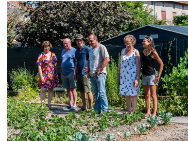
Les visiteurs s'intéressent au potager.

pillons blancs en mettant entre chaque plant des coquilles d'œufs sur un support. Plants de tomates, de pommes de terre : rien n'a échappé à l'œil des visiteurs, sans oublier les fleurs, l'arbre à perruches, le yucca... ■