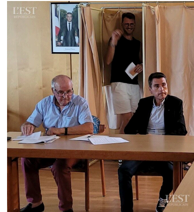
Le vote s'est déroulé à bulletins secrets dans des isolements installés salle du conseil municipal.