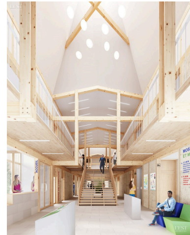
Le futur siège de la communauté de communes de Moselle et Madon se dévoile au public.

L'événement est ouvert à tous, sans inscription préalable. Les visiteurs sont invités à se rendre devant la maison du projet à l'heure indiquée, où des guides expérimentés les accompagneront tout au long de cette visite. ■