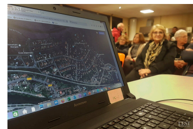
Aidés d'un ordinateur, les habitants montrent où se situent leurs priorités.

lement dans la catégorie des villes françaises. Ce palier devrait permettre de meilleures dotations mais reste surtout symbolique. La bonne attractivité de la commune risque de continuer avec différents projets en cours ou à venir : réaménagement du plan d'eau, installation d'un site industriel de traitement des plastiques à côté de la déchetterie... ■