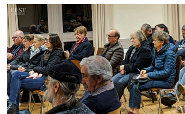
Le public attentif aux explications et à l'avancée des actions menées par l'ADLF.

maintenir le combat jusqu'à sa réouverture. De son côté, le député Dominique Potier relevait que « le rêve d'une poignée de citoyens est devenu un pacte d'élus consensuel » et que les lignes secondaires qui relient les villages aux grandes villes, permettent aussi l'accès à la Métropole pour l'emploi, la culture, la consommation.... ■