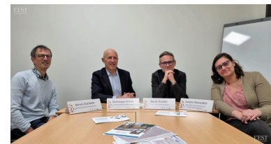
Dans une logique de « simplification », les deux entités se sont réunies.

entrepreneuriat ». Avec ses cinq collègues, elle continuera sa mission : épauler les porteurs de projets et les entrepreneurs confrontés à toutes sortes de problématiques d'ordre financier, énergétique, etc. Ceci en étant au plus proche des intéressés, par exemple lors de permanences tenues à la pépinière d'entreprises à Écrouves. ■