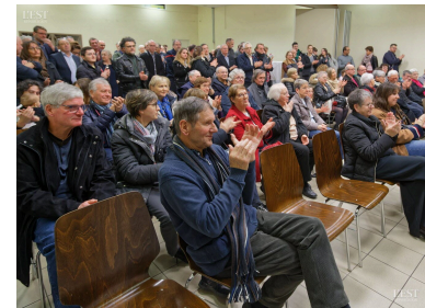
Le public présent a été attentif au discours du maire.

Le maire a conclu son allocution en soulignant que la priorité budgétaire est donnée au scolaire, périscolaire et à l'animation jeunesse ados. ■