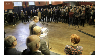
La cérémonie des vœux du président de la communauté de communes de Moselle et Madon à l'ensemble des forces vives de l'intercommunalité a rassemblé beaucoup de monde.

Enfin, revenant sur les projets qui s'achèveront fin 2023, le président a rappelé l'aménagement du quartier Champi situé entre l'Aqua'mm et la Filoche, et la construction du futur siège de la CCMM. ■