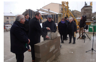
Les élus ont officiellement lancé le chantier du nouveau quartier.

Puis, viendra la création d'un quartier durable composé de 12 maisons destinées en priorité au primo accédant ■