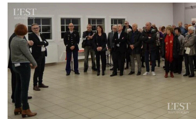
Une assemblée à l'écoute des élus.

(Noah, Arnaud, Lyse) et à un autre du village de Maron (Milou). Le maire a souhaité à tout le monde ses meilleurs vœux pour 2023 avant de les convier à passer au buffet. ■