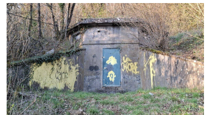
Le château d'eau ou réservoir du Paradis, construit à partir de 1937.

Gare. Son principal avantage est de fournir une eau sans calcaire, contrairement aux deux autres sources. Aujourd'hui, cette source alimente uniquement la fontaine rue de Flavigny. ■