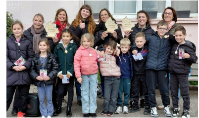
Fierté, sourires et récompenses pour les jeunes champions, entourés de leurs enseignantes.

La remise des récompenses s'est conclue par un goûter. ■