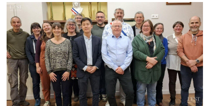
Le nouveau conseil municipal est en place.

La répartition des conseillers dans les commissions sera arrêtée dans les prochains jours. ■