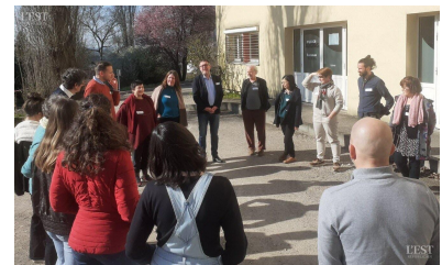
Une vingtaine d'acteurs du territoire réunis au centre Ariane pour l'assemblée générale.

Le Réseau Compost Citoyen organise, jusqu'au 12 avril , la 13 e opération nationale « Tous au compost » : sur le territoire, Covalom et les guides composteurs proposent de nombreuses animations pour sensibiliser le public. ■