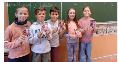
Cinq élèves sur le podium, applaudis par leurs camarades.