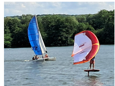
Le wingfoil, nouvelle discipline proposée à la base de loisirs.

► Renseignements : www.messein-loisirs.fr ■