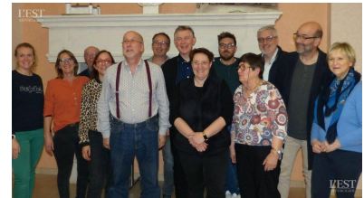
De nouveaux et anciens conseillers municipaux déjà au travail.

Les conseillers ont eu lecture de la charte des élus par le nouveau maire. Au prochain conseil, les élus préciseront leur choix pour les commissions de l'intercommunalité. ■