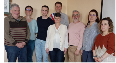
Le maire, les adjoints, les représentants du SIS et du Bélier-Meulson.