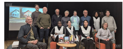
Les deux écrivains en haut à gauche, les élèves du lycée La Tournelle et l'association des Petits Frères des Pauvres.

La rencontre avec les deux écrivains a continué autour d'un petit goûter réalisé par les élèves, puis d'autres échanges ont pu avoir lieu lors de la dédicace de leurs deux ouvrages publiés (un troisième est en préparation). ■