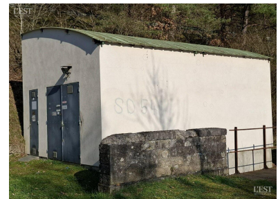
La station de captage du fond de Monvaux.

La source Jacquot subsiste toutefois : elle alimente encore les bassins situés avant le croisement ainsi que le lavoir derrière l'église. ■