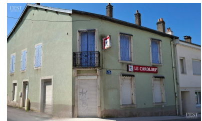
Le conseil a approuvé à l'unanimité l'étude d'impact financier du projet de réhabilitation de l'ancien restaurant.

Il appelle toutefois à la vigilance, en raison de sa dépendance aux recettes futures et de l'engagement financier qu'il nécessite. Globalement viable, il apparaît envisageable au regard des capacités actuelles de la commune, sous réserve d'un suivi rigoureux dans la durée. ■