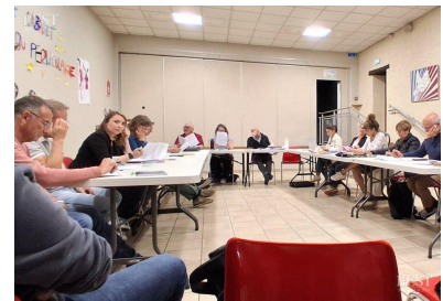
Séance de travail pour le conseil municipal.

Les élus ont également validé la mise en location de l'appartement communal situé au-dessus du groupe scolaire, fixé à 500 € mensuels hors charges. Enfin, Angélique Thary a été désignée correspondante incendie et secours auprès du SDIS. La séance s'est achevée après adoption de l'ensemble des délibérations à l'unanimité. ■