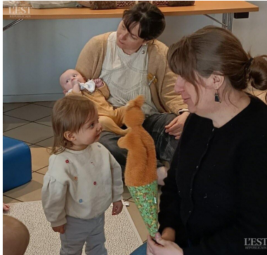
Des sons qui ont intrigué les petits.

L e Relais petite enfance (RPE) a proposé un éveil musical aux 15 bambins accompagnés de leur assistante maternelle. Un spectacle musical animé par Marie Doerler, éducatrice de jeunes enfants et musicienne. Le printemps et Pâques furent le sujet des « Petites Histoires de Mme Guitare ». D'un instrument ou d'un objet sortaient des sons divers qui ont intrigué les enfants. ■