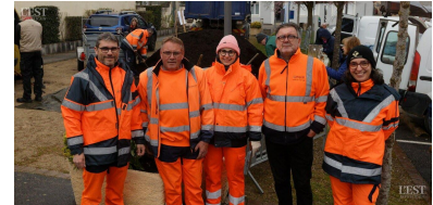
La Covalom au service des habitants.

Un stand pour découvrir les règles d'or du compostage et un autre pour apprendre à bien trier ses déchets étaient prévus sur les lieux où des agents de la Covalom accueillaient les habitants toujours curieux de vérifier la bonne façon de faire le tri. ■