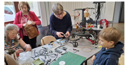
L'association Cekeltri a permis aux petits et aux grands de fabriquer de petits objets.