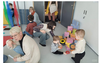
L'équilibre, exigence incontournable dans la construction d'un enfant.

Le relais petite enfance, les crèches, la médiathèque et la protection maternelle et infantile (PMI) se sont associés pour organiser cette matinée. ■