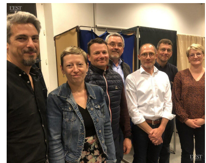
Le nouveau bureau de la CCPS, au service des 55 communes qui la composent.