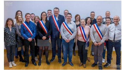
Le conseil municipal au complet.