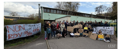
Parents, élèves et élus étaient nombreux pour protester devant l'école.

La mobilisation pourrait se poursuivre dans les prochaines semaines, en fonction de l'évolution du dossier. ■