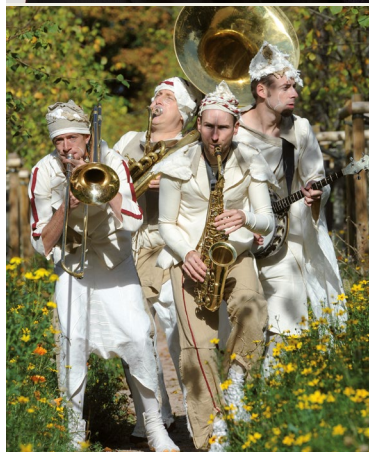
Fanfare OGM, cie La Chose Publique